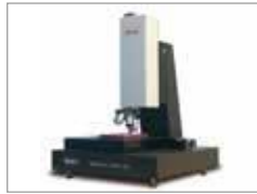
MarSurf sans contact